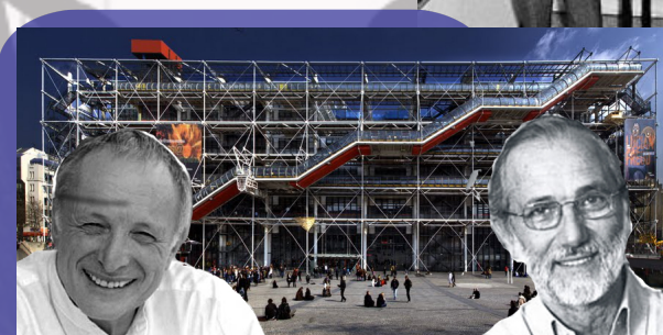
Renzo Piano et Richard Rogers Centre Pompidou Paris