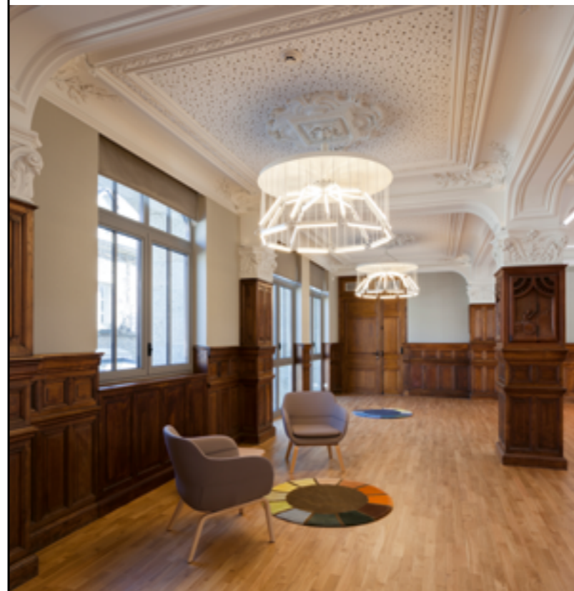
MATALI CRASSET, INTERACTIONS CHROMATIQUES, 2016, AMO BUREAU DES PROJETS, MUSÉE DE PONT-AVEN (FINISTÈRE), COMMANDE DE CONCARNEAU CORNOUAILLE AGGLOMÉRATION AU TITRE DU 1 % ARTISTIQUE.

d'Émile Bernard, de Paul Sérusier et de Maurice Denis, dont j'ai créé les palettes imaginaires. Chaque palette a pris la forme d'un tapis disposé sous un lustre comme si c'était sa projection au sol. J'avais l'idée de donner envie aux visiteurs de découvrir quelle peinture se cache derrière chacune de ces gammes chromatiques. La collaboration, l'installation, la médiation avec le musée, la conservatrice et toute son équipe ont été de beaux moments de partage et d'échange.