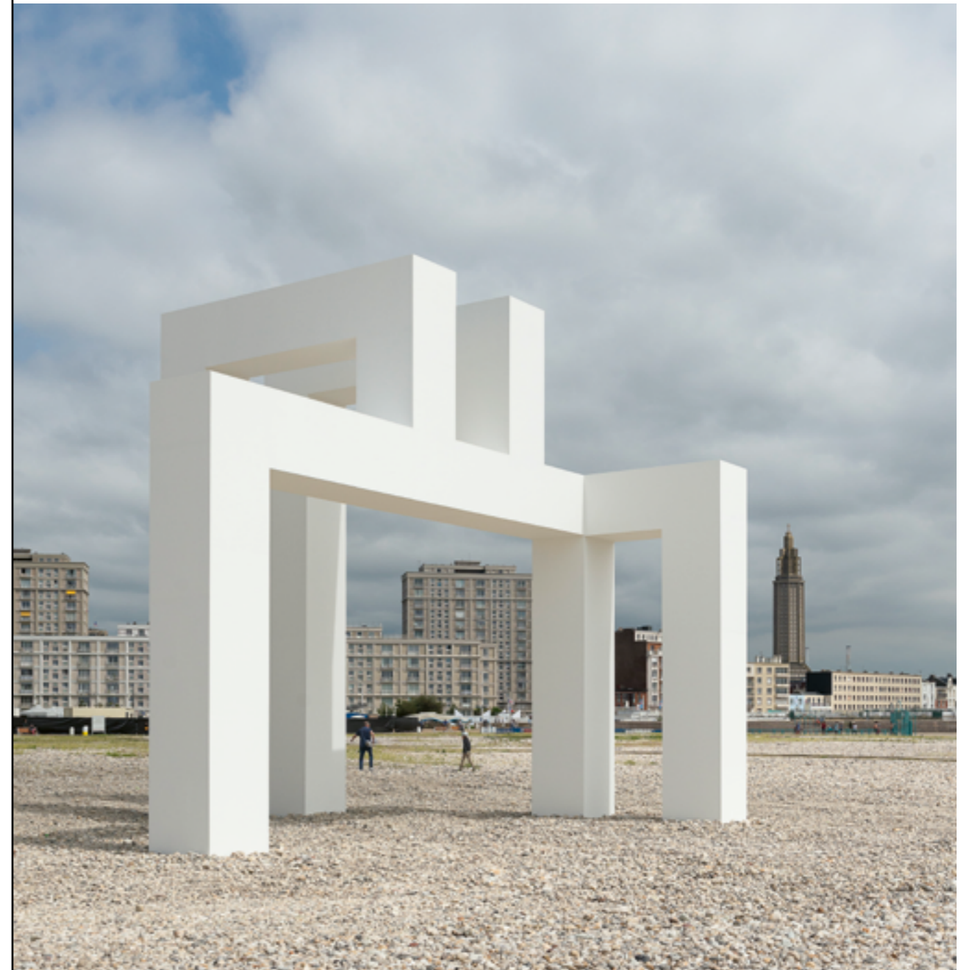
LANG/BAUMANN, UP #3 , 2017, ŒUVRE RÉALISÉE DANS LE CADRE D'« UN ÉTÉ AU HAVRE » PUIS PÉRÉNNISÉE, LE HAVRE (SEINE-MARITIME), COMMANDE DU GIP LE HAVRE 2017 AVEC LE MÉCÉNAT DE VINCI CONSTRUCTION FRANCE ET SA FILIALE GTM NORMANDIE.