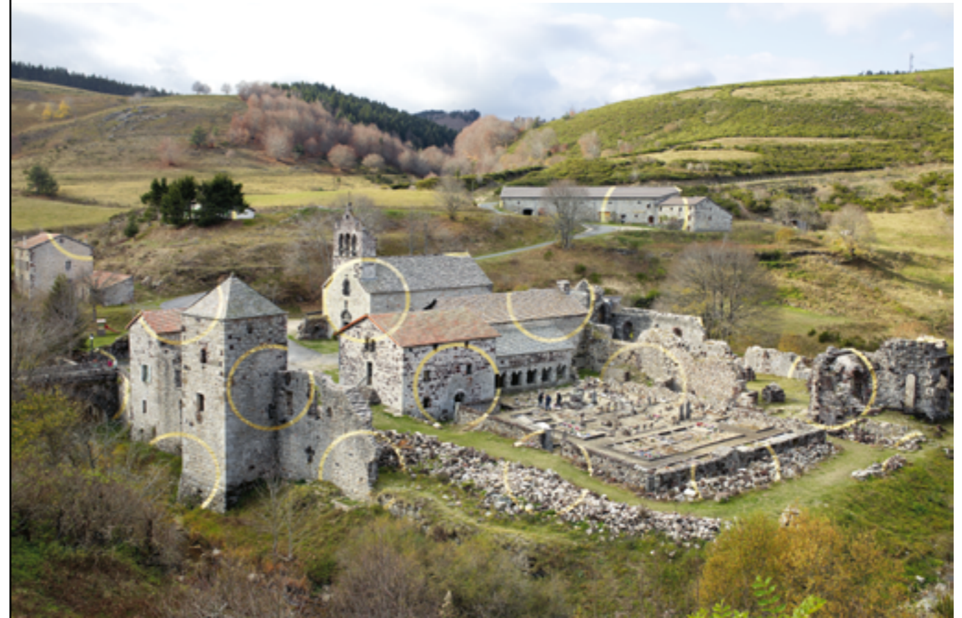
FELICE VARINI, UN CERCLE ET MILLE FRAGMENTS , 2017, INTERVENTION À LA FEUILLE D'OR SUR LES RUINES DE L'ABBAYE DE MAZAN, MAZAN-L'ABBAYE (ARDÈCHE), COMMANDE DU PARC NATUREL RÉGIONAL DES MONTS D'ARDÈCHE DANS LE CADRE DU PROGRAMME « LE PARTAGE DES EAUX » AVEC LE SOUTIEN DU MINISTÈRE DE LA CULTURE.

Les articles L.2194-1, R.2194-1 à R.2194-10 du code de la commande publique prévoient une liste limitative de cas dans lesquels il est possible de modifier le marché en cours d'exécution, par exemple lorsque des travaux supplémentaires sont devenus nécessaires.