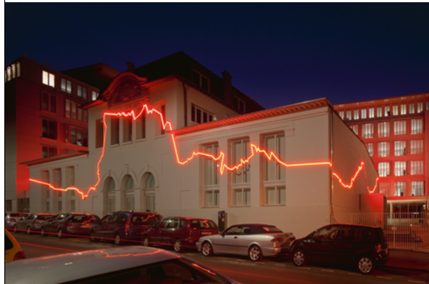
ANGELA DETANICO ET RAFAEL LAIN, LA CEINTURE DE FEU, 2010, AMO AGENCE PIÈCES MONTÉES, INSTALLATION LUMINEUSE, NÉON ROUGE, INSTITUT DE PHYSIQUE DU GLOBE, ARCHITECTE ATELIERS LION ASSOCIÉS, PARIS (ÎLE-DE-FRANCE), COMMANDE DU MINISTÈRE DE L'ENSEIGNEMENT SUPÉRIEURE ET DE LA RECHERCHE AU TITRE DU 1 % ARTISTIQUE.

Par souci de sécurité juridique, il est préconisé de respecter scrupuleusement la procédure, y compris lorsqu'elle est facultative.