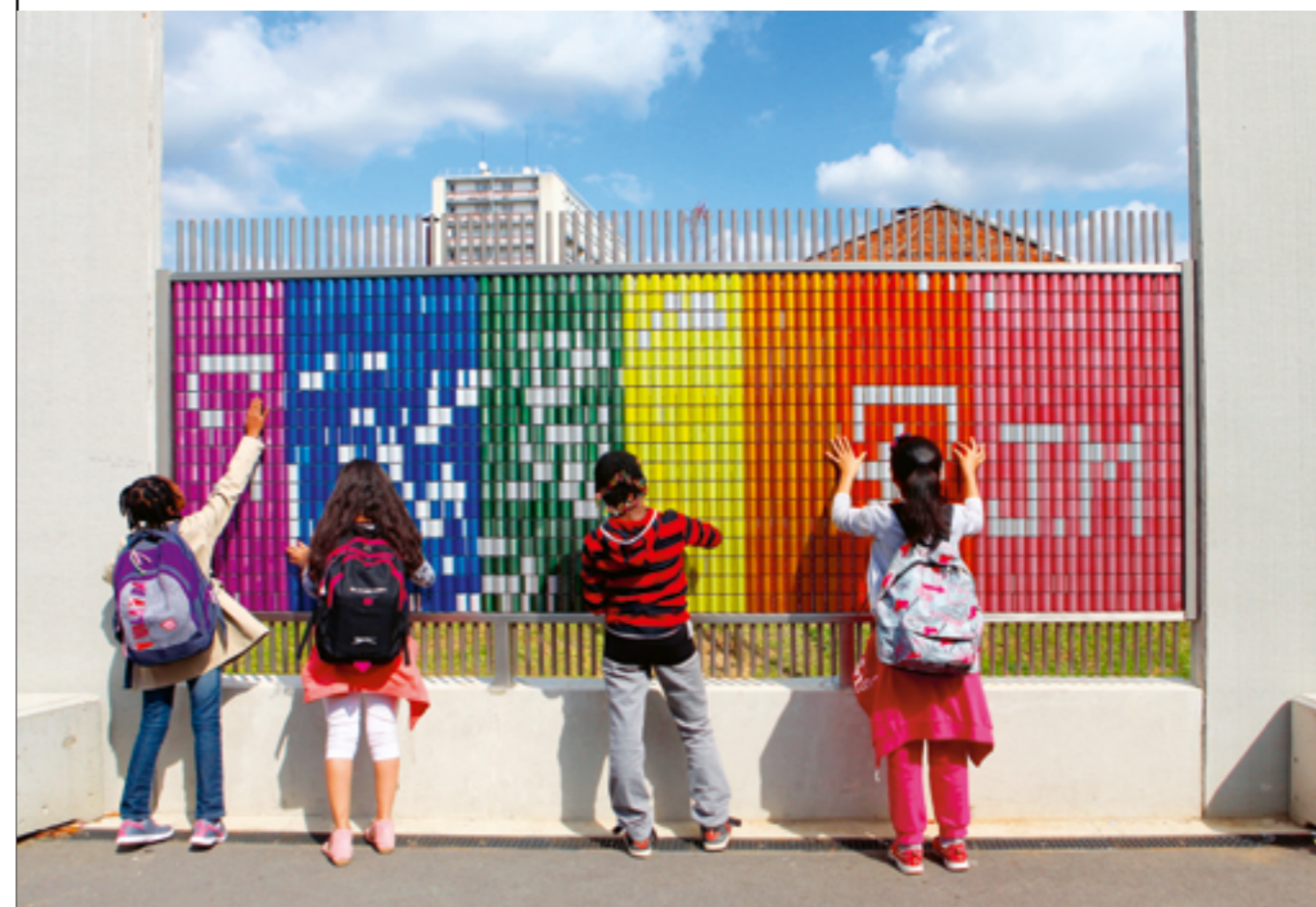
PATRICK BERNIER ET OLIVE MARTIN, WAMPICÔN, 2014, 1386 PERLES D'ALUMINIUM BICOLORES ET TUBES D'ACIER INOXYDABLE, PRODUCTION ROOM SERVICE AAC, COLLÈGE JEAN-MOULIN, LELLI ARCHITECTES, AUBERVILLIERS (SEINE-SAINT-DENIS), COMMANDE DU CONSEIL DÉPARTEMENTAL DE LA SEINE-SAINT-DENIS/EIFFAGE AU TITRE DU 1 % ARTISTIQUE.

— le maître d'ouvrage ou son représentant, qui en assure la présidence et a voix prépondérante en cas de partage égal des voix, — l'ambassadeur de France dans le pays concerné ou son représentant, — l'architecte, — le directeur général de la création artistique (DGCA) ou son représentant, — deux personnalités qualifiées dans le domaine des arts plastiques, dont l'une est désignée par le maître d'ouvrage et l'autre par l'ambassadeur de France.