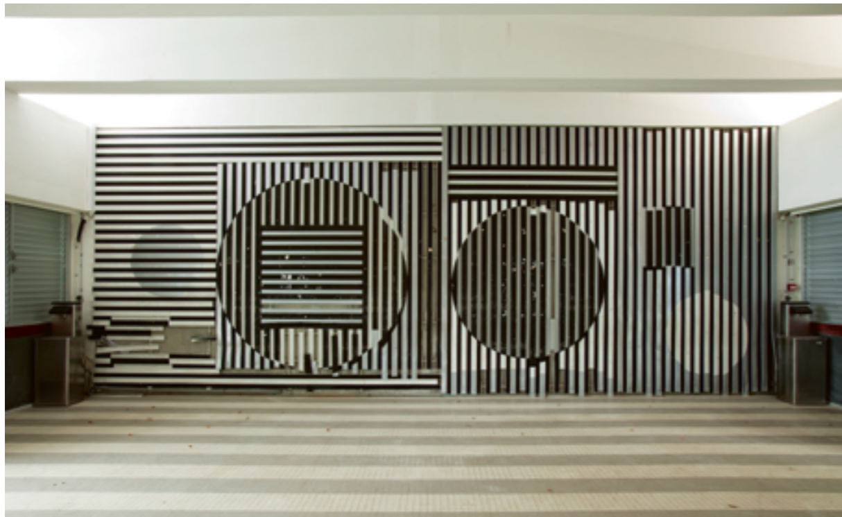
VICTOR VASARELY, INTÉGRATION INTÉRIEURE , 1972, REVÊTEMENT EN MÉTAL, COLLÈGE CHARLES-DE-GAULLE, ARCHITECTES RAYMOND CREVAUX ET JACQUES TESSIER, MORNE-À-L'EAU (GUADELOUPE), COMMANDE DU MINISTÈRE DE L'ÉDUCATION NATIONALE AU TITRE DU 1 % ARTISTIQUE (PROPRIÉTAIRE ACTUEL : CONSEIL GÉNÉRAL DE GUADELOUPE).

Dans le cas du 1 % artistique, l'architecte du bâtiment dispose aussi de droits moraux et patrimoniaux sur sa réalisation. Par conséquent, les reproductions de l'œuvre sur lesquelles le bâtiment est visible supposent qu'un contrat de cession de droits a aussi été conclu avec l'architecte.