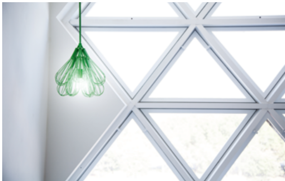
MATALI CRASSET, ÉMULSION, 2012, AMO AGENCE PIÈCES MONTÉES, LYCÉE GEORGES-FRÉCHE, ARCHITECTE MASSIMILIANO FUKSAS, MONTPELLIER (HÉRAULT), COMMANDE DE LA RÉGION LANGUEDOC-ROUSSILLON AU TITRE DU 1 % ARTISTIQUE.