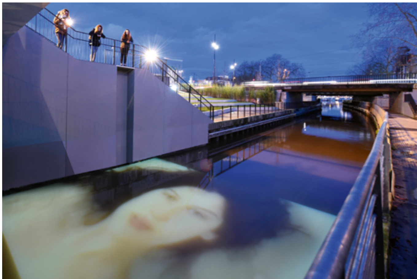
ANGE LECCIA, NYMPHÉA, 2007, PROJECTION VIDÉO, NANTES (LOIRE-ATLANTIQUE), COMMANDE D'« ESTUAIRE » DANS LE CADRE DE LA MANIFESTATION DE 2007.

européenne (JOUE). La publicité peut être faite sur le profil acheteur. L'objectif est d'avoir la publicité la plus adaptée au projet et d'en assurer la plus grande diffusion auprès des candidats potentiels.