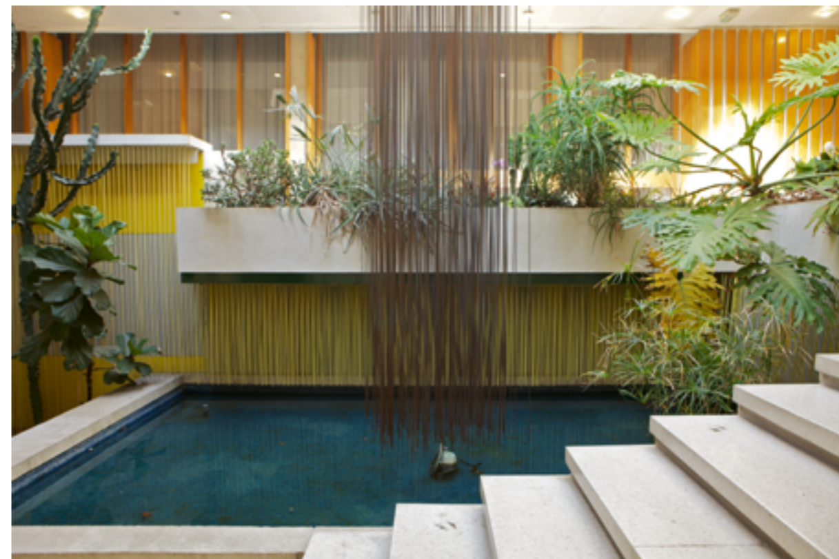
JESÚS RAFAEL SOTO, SANS TITRE, 1970, SCULPTURE SUSPENDUE ET DEUX MURS CINÉTIQUES, TIGES EN DURAL POLYCHROME, UNIVERSITÉ DE RENNES 1, ARCHITECTE LOUIS ARRETCHÉ, RENNES (ILLE-ET-VILAINE), COMMANDE DU MINISTÈRE DE L'ÉDUCATION NATIONALE AU TITRE DU 1 % ARTISTIQUE.

Maintenir l'identification de l'œuvre dans le temps demande une transmission de l'information qui peut se faire en installant un cartel, un panneau d'interprétation accessible à tous, une signalétique spécifique, en publiant une plaquette ou en organisant des actions culturelles (rencontre, parcours de visite, concours photos, etc.). Une bonne connaissance des œuvres favorise leur préservation, leur appropriation et leur valorisation. Les Archives nationales possèdent l'ensemble des documents relatifs au 1 % artistique conservés par le ministère de la Culture jusqu'en 1993. Le Cnap conserve de son côté la documentation relative aux commandes publiques artistiques soutenues par le ministère de la Culture ou commandées par l'État depuis 1983. Le ministère de la Culture (DGCA) et chaque DRAC disposent d'une liste des projets ayant bénéficié de son accompagnement. Chaque commanditaire est responsable de la procédure qu'il engage et tenu de conserver les documents qui y sont attachés.