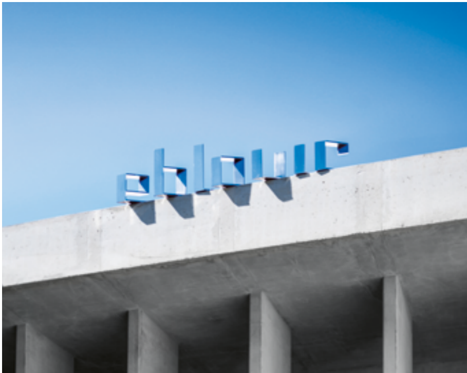
RAPHAËL DALLAPORTA ET PIERRE NOUVEL, ÉBLOUIR/OUBLIER , 2019, SCULPTURE INOX INTERAGISSANT AVEC LE SOLEIL, 230 × 50 × 30 CM, ÉCOLE NATIONALE SUPÉRIEURE DE LA PHOTOGRAPHIE, ARCHITECTE MARC BARANI, ARLES (BOUCHES-DU- RHÔNE), COMMANDE DU MINISTÈRE DE LA CULTURE AU TITRE DU 1 % ARTISTIQUE.