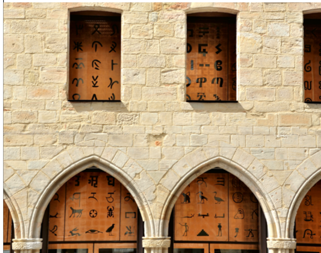
PIERRE DI SCIULLO, LA FAÇADE AUX MILLE LETTRES, 2003, MOUCHARABIEH TYPOGRAPHIQUE POLYGLOTTE, MUSÉE CHAMPOLLION, ARCHITECTES MOATTI-RIVIÈRE, FIGEAC (LOT), COMMANDE DE LA VILLE DE FIGEAC AU TITRE DU 1 % ARTISTIQUE.

Il est conseillé d'organiser la communication, par voie numérique ou papier, en amont de l'installation pour préparer sa présentation publique. Tous les documents doivent être validés par le ministère avant diffusion et comporter son logo. Pour toutes les commandes artistiques, les services du ministère de la Culture peuvent être amenés à demander des images de l'œuvre pour la communication événementielle liée à l'inauguration et les relations avec la presse régionale, nationale et internationale. Le respect du droit d'auteur, notamment des droits de reproduction et de représentation, est impératif, son absence pouvant mettre en cause l'État et les collectivités dont l'exemplarité sur le terrain de la propriété intellectuelle doit être incontestable.