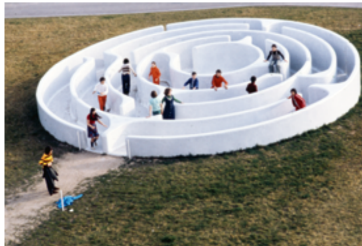
MARTA PAN, LABYRINTHE , 1973, BÉTON REVÊTU DE TESSELLES EN ÉMAUX DE BRIARE, LYCÉE MADAME-DE-STAEËL, ARCHITECTE JEAN DUBUISSON, MONTLUÇON (ALLIER), COMMANDE DU MINISTÈRE DE L'ÉDUCATION NATIONALE AU TITRE DU 1 % ARTISTIQUE (PROPRIÉTAIRE ACTUEL : CONSEIL RÉGIONAL D'Auvergne).

Le droit moral, qui impose le respect de l'œuvre, permet à l'auteur de s'opposer à sa modification. Ainsi, pour toute intervention, y compris un changement d'emplacement, si l'œuvre a été conçue pour un site spécifique, il faut obtenir au préalable son accord ou celui de ses ayants droit.