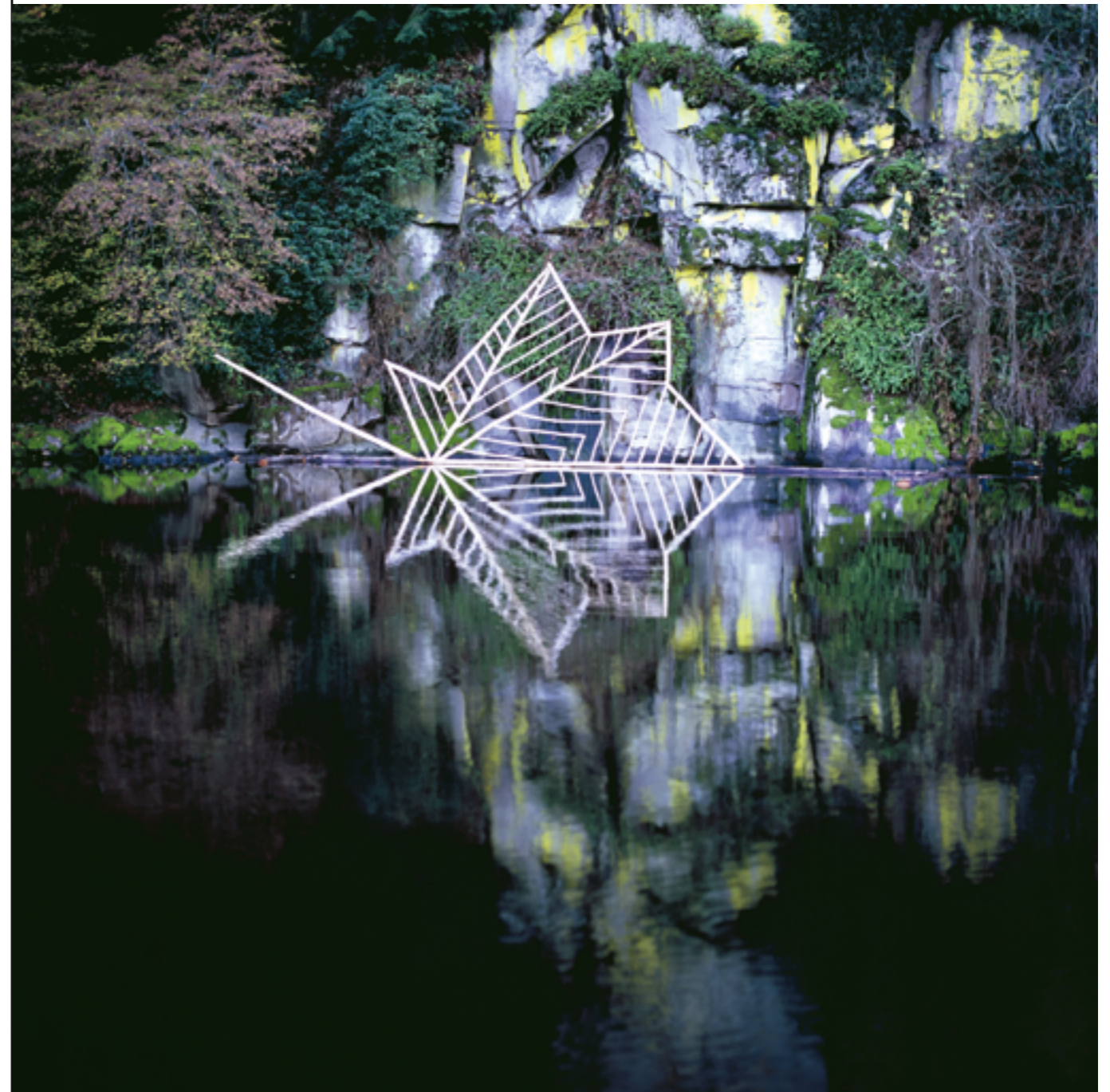
NILS-UDO, RADEAU D'AUTOMNE X , BRANCHES DE CHÂTAIGNIER ÉCORCÉES ET TRONCS DE DOUGLAS, ARCHIVAL PIGMENT PRINT, 150 × 150 CM, 2012, CROZANT (CREUSE), COMMANDE D'ÉGUZON-CHANTÔME, EN PARTENARIAT AVEC LA COMMUNE DE CROZANT, AVEC LE SOUTIEN DU MINISTÈRE DE LA CULTURE.

En liaison avec le cabinet du ministre de la Culture, la DGCA concourt à la définition de la politique du gouvernement dans le domaine des arts plastiques et du spectacle vivant. Elle la coordonne et l'évalue en l'inscrivant dans une logique plus large d'aménagement et de développement du territoire. Ses missions couvrent, dans les domaines relevant de ses compétences, le soutien à la création, l'aide à l'insertion professionnelle, l'enrichissement des collections publiques, l'élargissement des publics et des réseaux de diffusion. Au sein de cette administration centrale, le pôle de la commande artistique pilote les dispositifs nationaux que sont le 1 % artistique, la commande publique et l'aide à la commande, la charte spécifique à la commande privée appelée « 1 immeuble, 1 œuvre », et organise le Conseil national des œuvres dans l'espace public dans le domaine des arts plastiques. Les conseillers pour les arts plastiques des DRAC qui accompagnent les projets peuvent solliciter l'expertise et le conseil de la DGCA à toute étape d'un projet.