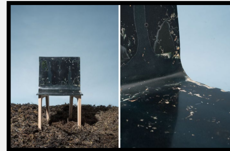
Chaise Alqa, 2016

2. Expliquez en quoi consiste le travail de Samuel Tomatis . Pourquoi peut-on parler de design durable ?