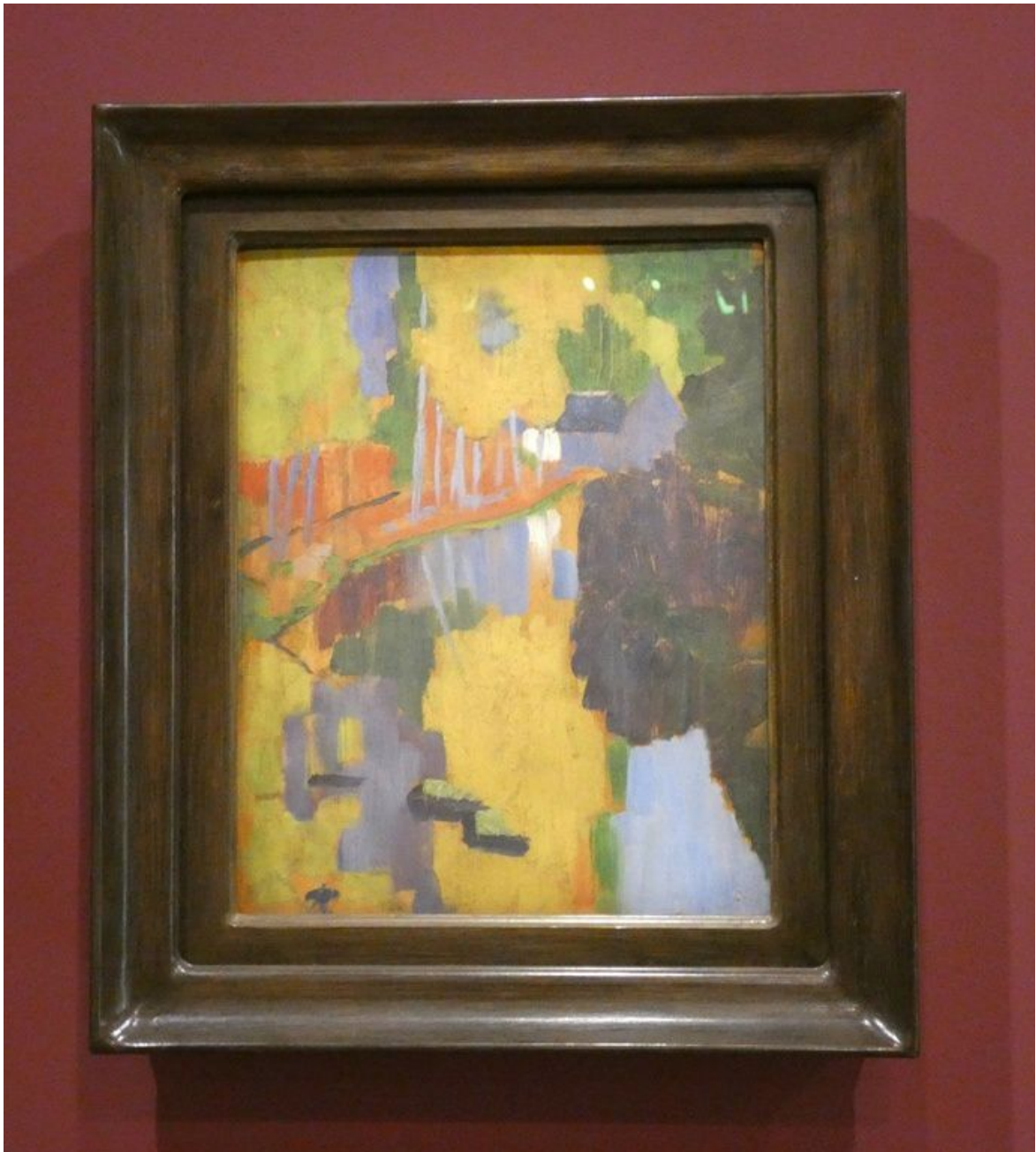
Paul SERUSIER (1864-1927), Le Talisman, Paysage au Bois d'Amour , en 1888, huile sur bois de 27 x 21,5 cm, Musée d'Orsay, Paris.