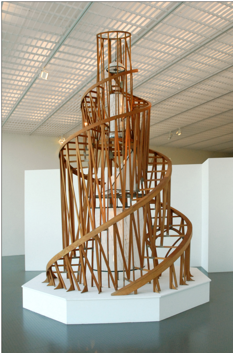
Vue de l'exposition Chefs-d'oeuvre au Centre Pompidou Metz en 2010.

Œuvre la plus célèbre de Vladimir Tatline, ce monument ne fut jamais réalisé. Subsistent des dessins, des maquettes, des documents photographiques. Cette reconstitution a été réalisée en 1979 pour le Centre Pompidou Paris, à l'occasion de l'exposition Paris Moscou . Censé abriter les centres administratifs et de propagande de la III ème Internationale, ce monument, constitué de 2 spirales métalliques enlacées autour de 4 volumes suspendus en verre, devait composer un ensemble dynamique. La Maquette du Monument à la Troisième Internationale de Tatline, haute de 5 m, a été présentée à Petrograd en novembre 1920.