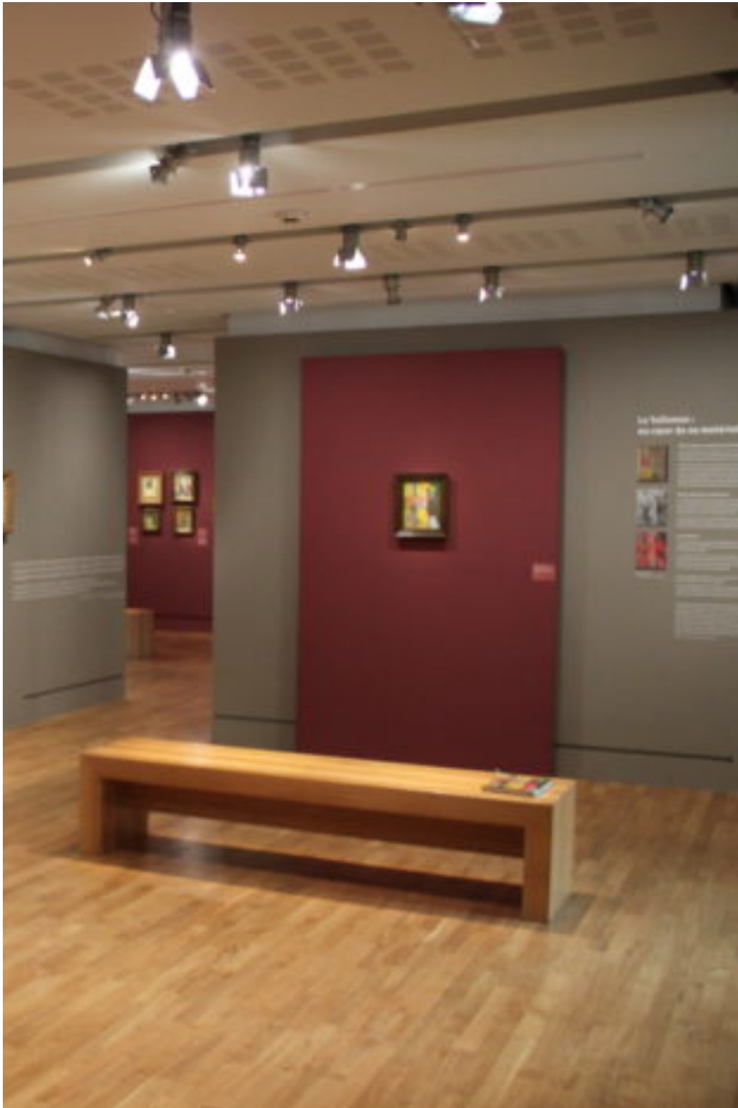
Vue de l'exposition Le Talisman de Paul Sérusier, une prophétie , du 29 janvier au 28 avril 2019 au Musée d'Orsay, à Paris.