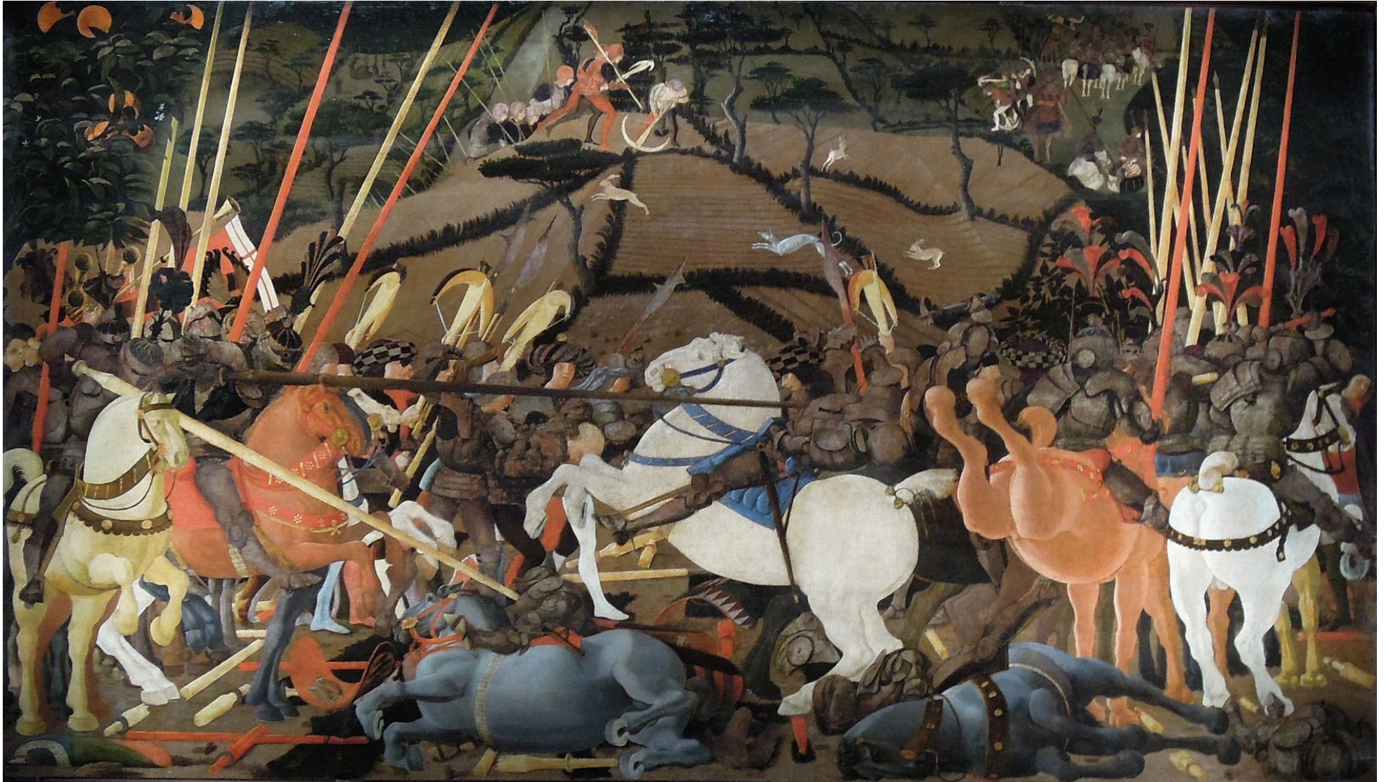
Paolo UCCELLO, La Bataille de San Romano, Bernardino della Ciarda désarçonné , 1436-1440, tempera sur panneau de bois, 188 x 327 cm. galerie des Offices, Florence, Italie.