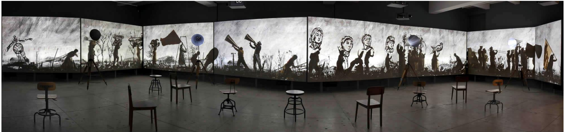
William KENTRIDGE, More Sweetly Play the Dance (Jouer la danse plus doucement) , 2015, dimensions variables, installation vidéo 8 canaux haute définition, 15 min, avec 4 porte-voix. Musée des beaux-arts du Canada, Ottawa, Canada. Vue d'installation à la galerie Marian Goodman, New York, 2016, États-Unis.