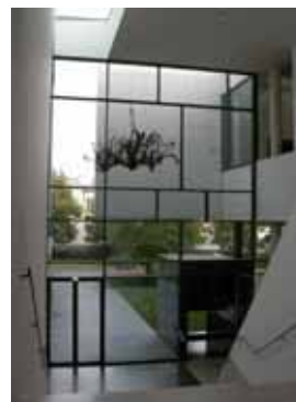
Extension contemporaine du musée des beaux-arts, Nancy 2007.

Les écomusées deviennent alors l'expression d'une diversité culturelle et des moyens d'affirmer l'identité d'une communauté autour d'un patrimoine.