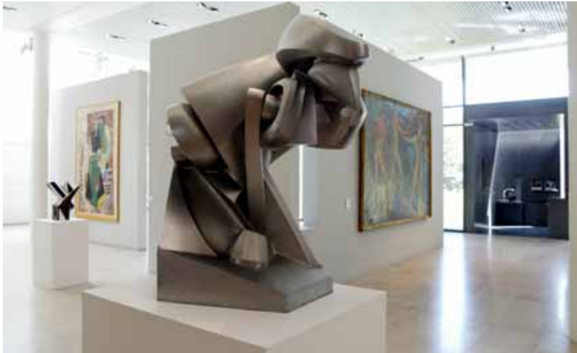
La salle des collections d'art moderne du musée des beaux-arts à Nancy en 2006.