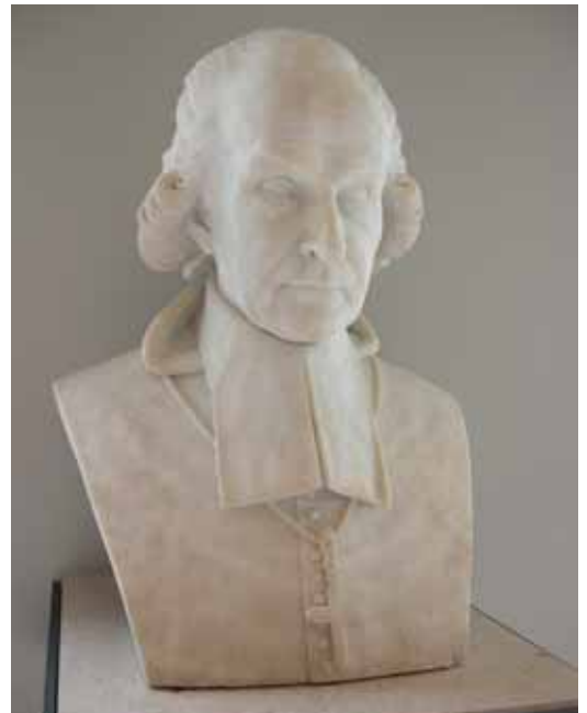
Portrait de l'Abbé Grégoire 1828

A LA FIN DU XVIII e SIÈCLE, ET PENDANT LA RÉVOLUTION, de nombreuses œuvres ayant appartenu aux collections princières ou à l'église sont détruites ou vendues afin de combler le déficit public. Un choix est opéré parmi ces biens pour que les oeuvres majeures soient sauvegardées. Elles sont transférées dans des musées ouverts au public dans un souci pédagogique. L'Etat doit devenir conservateur au nom de l'histoire nationale et de l'instruction. Apparaissent d'ailleurs en 1791 les premières règles de conservation et d'inventaire. Par conséquent, comme dans toute l'Europe, les collections royales se dévoilent au grand jour : il en est ainsi de la Grande Galerie du Louvre devenue Muséum des Arts en 1793, du Conservatoire National des Arts et Métiers, de la transformation du Jardin des Plantes en Muséum d'Histoire Naturelle. L'ouverture de ces lieux au public nécessite l'étude des éclairages, de la sécurité, du cloisonnement déjà amorcée sous le règne de Louis XVI.