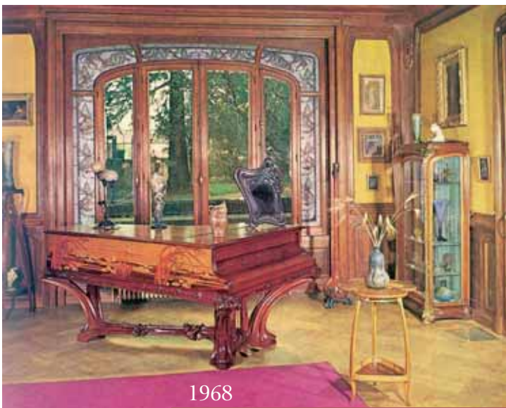
Une salle du premier étage du musée des beaux-arts hier et aujourd'hui