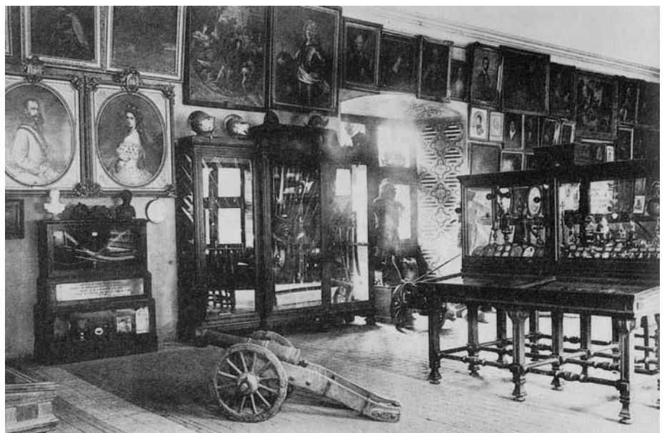
La galerie des cerfs du Musée Lorrain à Nancy en 1912

Humaniste danois, Olaus Worm (1588-1664) réunit à des fins pédagogiques une collection de merveilles de la nature en 1620. Ses recherches sont collectées dans les catalogues qu'il a fait imprimer de son vivant. Mais l'aboutissement de son travail figure dans le « Museum Wormianum » ouvrage précieux publié en latin après sa mort, dont est tiré cette illustration. Ses collections seront installées par Frederik III du Danemark au château royal.