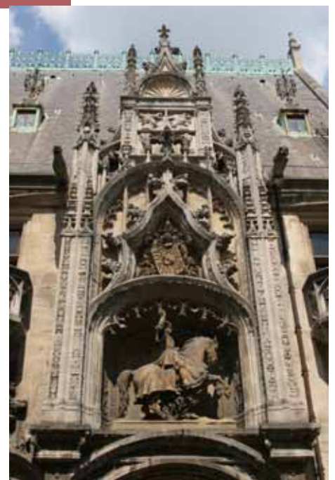
Musée Lorrain – détail de la porterie

Dans de nombreuses villes de France, des SOCIÉTÉS SAVANTES LOCALES sont à l'origine de fondations qui donneront naissance à des musées : c'est le cas à Nancy en 1848 où la Société Lorraine d'Archéologie donne le jour au Musée Historique Lorrain.