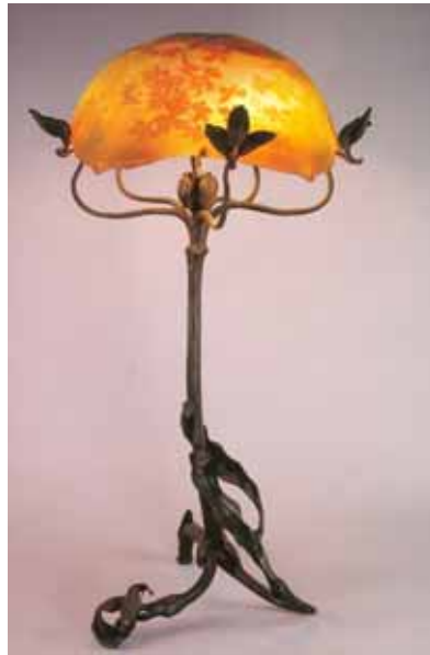
Lampe aux ombelles 1902 Émile Gallé (1846-1904) musée de l'École de Nancy

favorisera également l'alliance de l'art et de l'industrie lors d'Expositions universelles ou dans la création de musées d'art décoratif : à Nancy, la Société des Arts Décoratifs lorrains puis l'Alliance Provinciale des Industries d'Art (Association de l'École de Nancy) revendiquent un nouveau statut pour les arts décoratifs et la nécessité de leur consacrer un musée à Nancy. La municipalité accède à cette demande en leur octroyant en 1904 une salle du musée de l'Hôtel de ville.