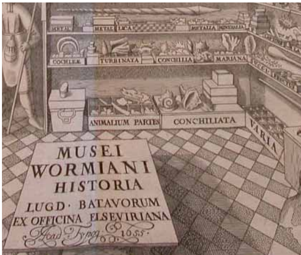
Détail d'une représentation du cabinet de curiosités de Olaus Worm 4

les collections de « curiosités » embrassent tous les domaines de connaissance et sont souvent présentées sous forme de microcosmes dans les cabinets de curiosité privés des « humanistes » qu'ils soient princes, prélats, médecins, juristes, ou artistes : à la différence des collections de l'époque précédente, ces cabinets, définis comme de « VASTES THÉÂTRES EMBRASSANT LES MATIÈRES SINGULIÈRES ET LES IMAGES EXCELLENTE DE LA TOTALITÉ DES CHOSES 3 » illustrent peu à peu la domination de l'homme sur la nature. Les collections artistiques soulignent la passion vouée à la beauté antique. C'est ainsi que se constituent en Europe de magnifiques collections princières qui encouragent le marché de l'art, à l'image de celle de François 1 er . Le prestige de la collection devient peu à peu un moyen de reconnaissance sociale.