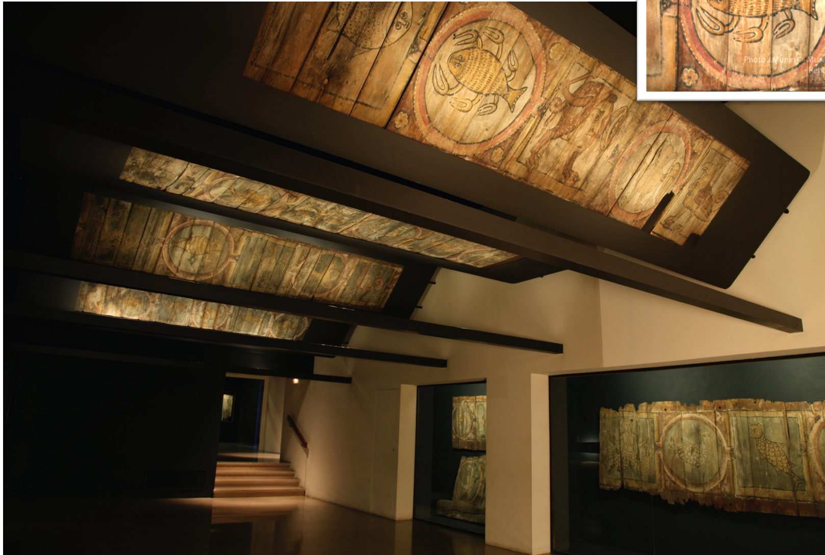
Plafond au bestiaire peint du n°8 rue Poncelet, Metz, détrempe (pigments, eau et colle soluble) sur planches de chêne, XIIIème siècle, Musée de la Cour d'Or, Metz.