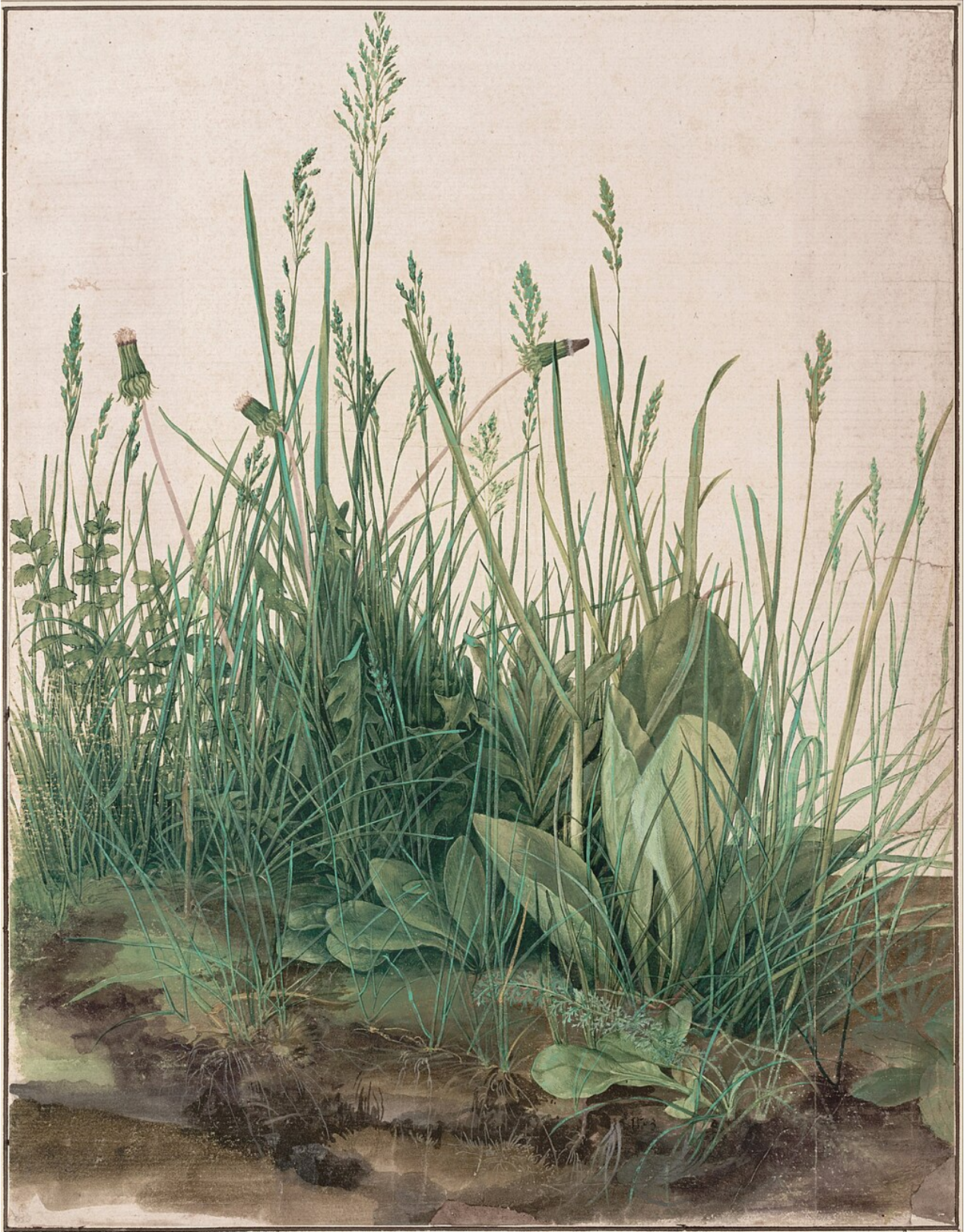
Albrecht Dürer (1471-1528), La Grande Touffe d'Herbes , aquarelle et gouache sur papier, 41 x 31,5 cm, réalisé dans son atelier de Nuremberg en 1503. Collection graphique du musée Albertina, Vienne (Autriche).