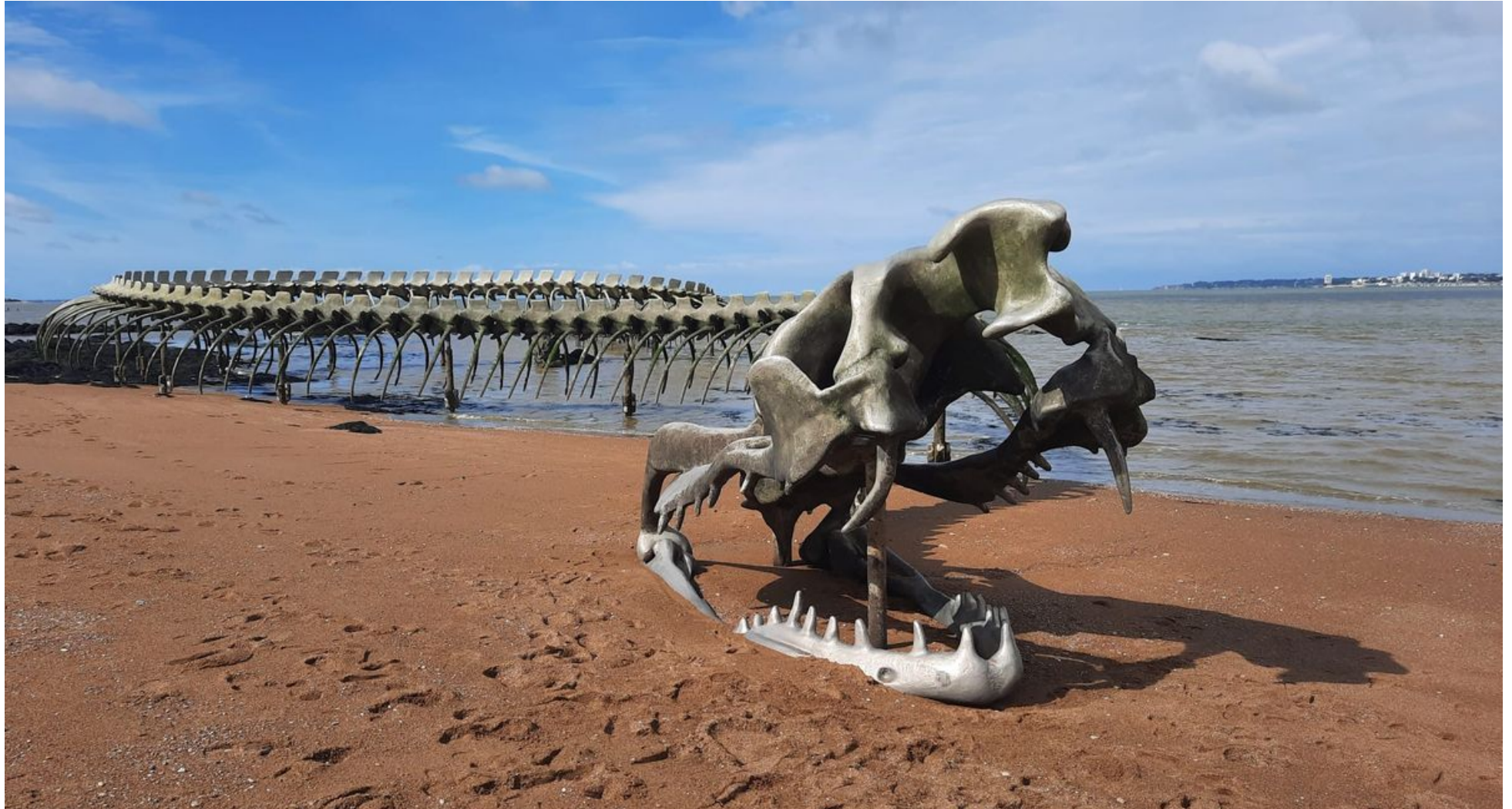
Huang Yong Ping (1954-2019), Serpent d'Océan , 2012, aluminium, L. : 128 m, H. : 3 m, création pérenne dans le cadre du parcours Estuaire, Saint-Brevin-les-Pins, Pointe de Mindin, Loire-Atlantique.