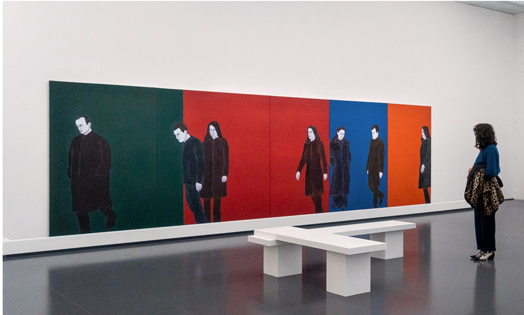
Djamel Tatah (1959 -), Sans Titre , 1999, huile et cire sur toile (5 éléments joutés), 220 x 760 cm, Centre national des Arts Plastiques, Paris. Vue de l'exposition La Répétition , Centre Pompidou Metz, 04/02/2023 au 27/01/2025.