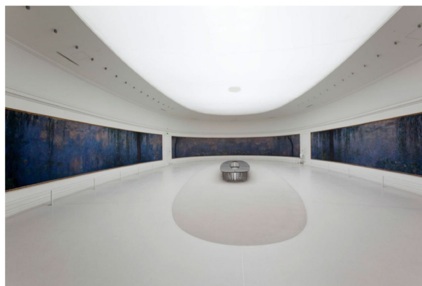
Claude MONET (1840-1926), Cycle des Nymphéas du musée de l'Orangerie , entre 1897 et 1926, huile sur toile, H. : 1,97 m, L. : environ 100 m linéaires, surface environ 200 m 2 , Paris, musée de l'Orangerie.