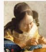
La Dentellière 837