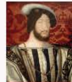
François I er 822