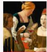
Le triquetration 912