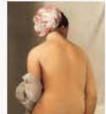
La baigneuse 949