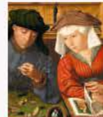
Le prêtre et sa femme 814