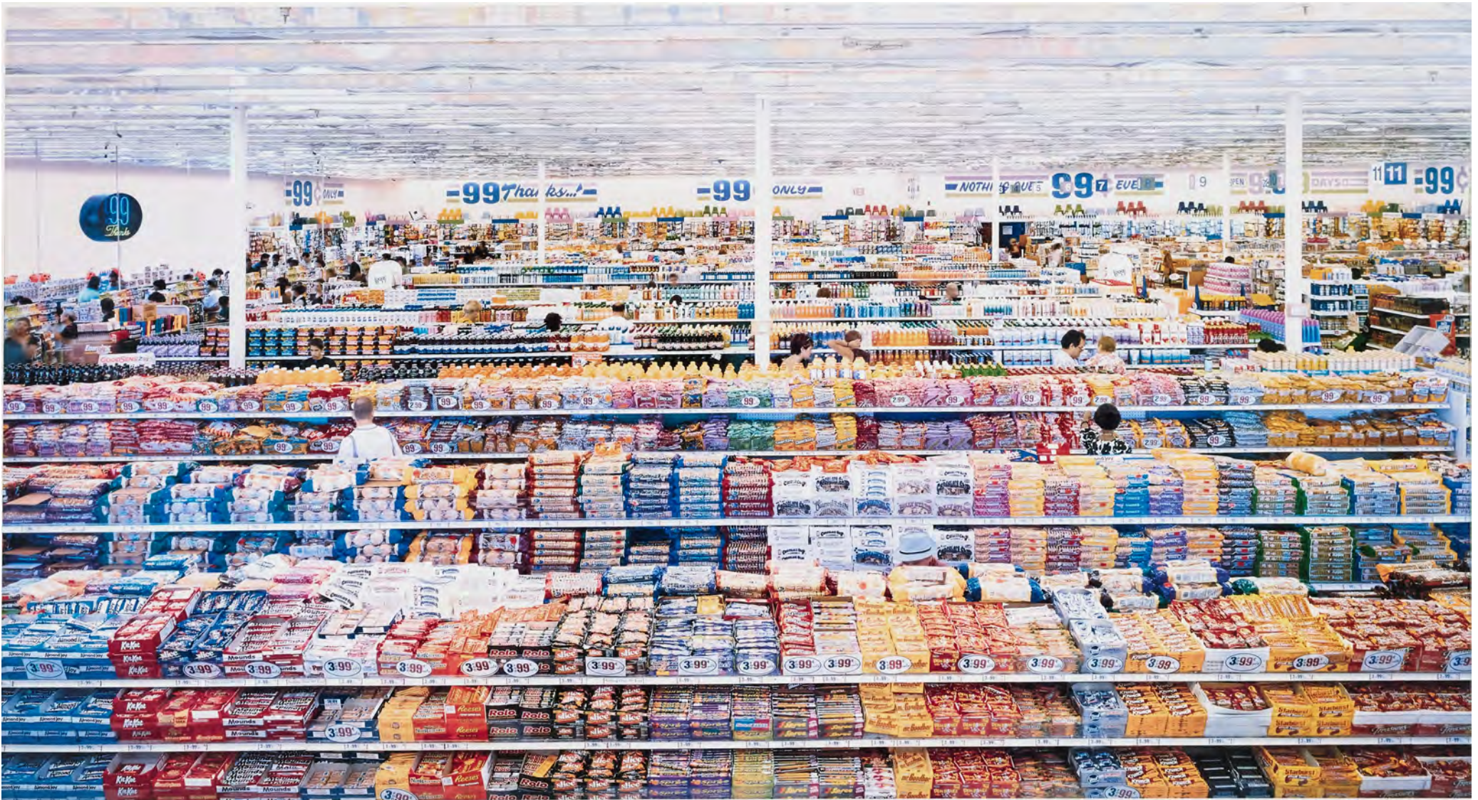
Andreas GÜRSKY, 99 Cent , 1999, tirage : 5/6, photographie, épreuve couleur sous Diasec, épreuve chromogène, 206,5 x 337 x 5,8 cm (197 x 327 cm hors marge). Musée national d'art moderne (MNAM), Paris, France.