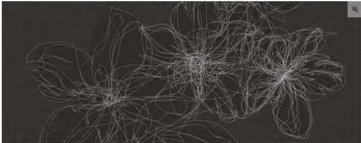
Michel Paysant (1955) SAKURA NOIR, 2024 © courtesy Michel Paysant/ © Adagg, Paris, 2026

Du 01 octobre 2025 au 26 janvier 2026 - Musée de l'Orangerie