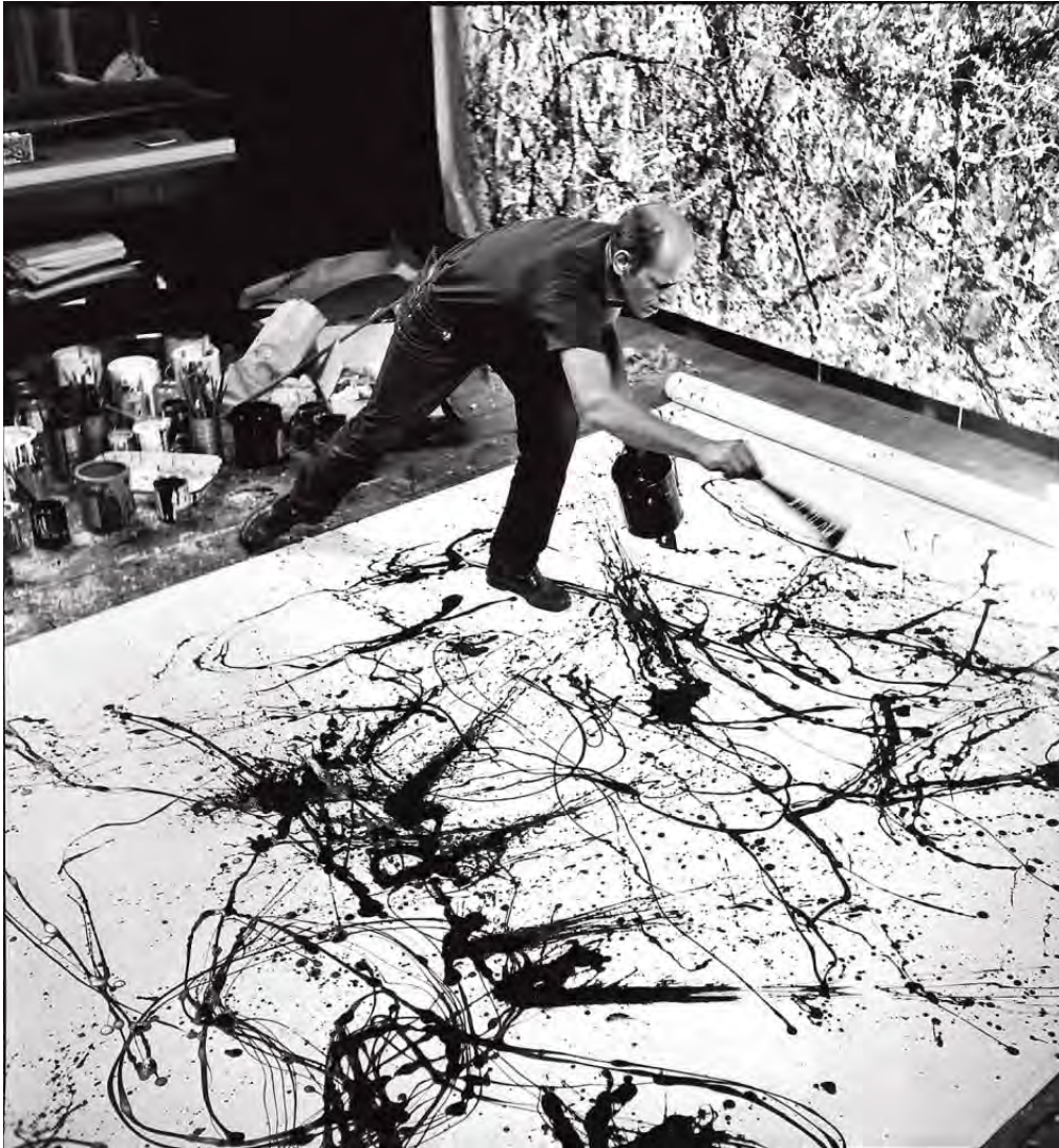
Hans NAMUTH (1915-1990), Jackson Pollock peignant , 1950, Tirage argentique gélatino-bromure 48,5 x 38,7 cm.