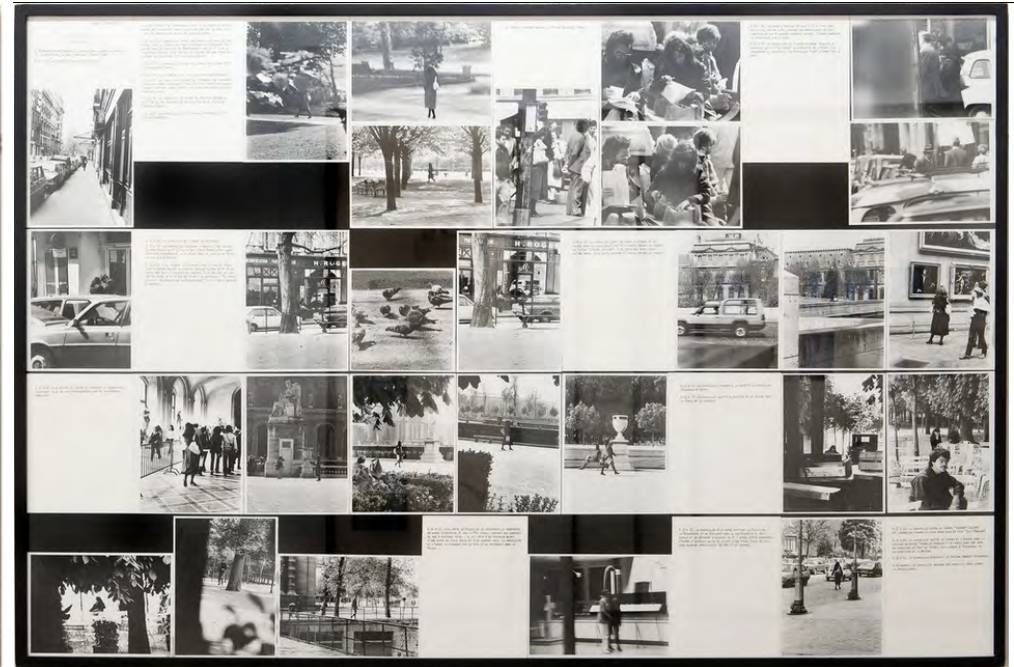
Sophie CALLE (1953-), Autoportrait (La filature), Diptyque (indissociable), Photographie, Photographies noir et blanc, texte photocomposé, 112,5 x 166 cm chaque cadre.

Extrait du le catalogue d'exposition " Sophie Calle, M'as tu vue ", édité à l'occasion de l'exposition éponyme au Centre Pompidou, Paris, édition Xavier Barral