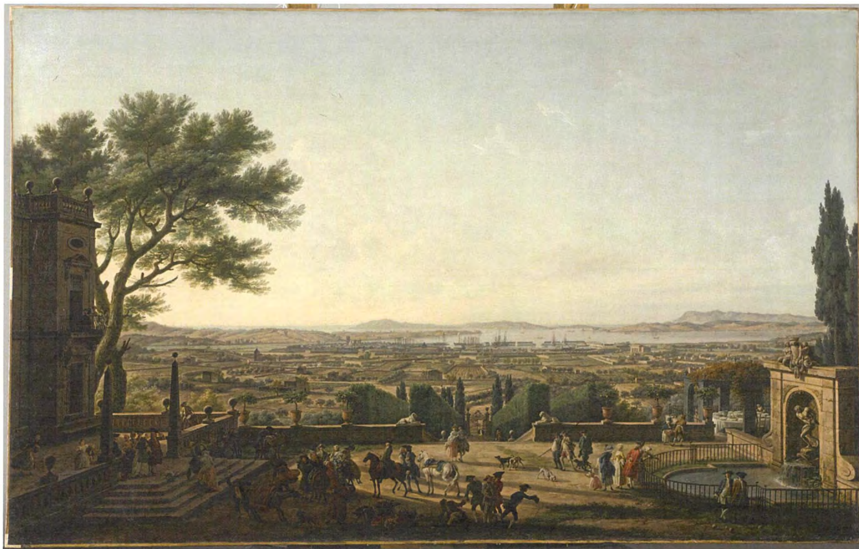
Joseph Vernet, La ville et la rade de Toulon, deuxième vue, le port de Toulon, vue du mont Faron , 1756, huile sur toile, 165 cm x 263 cm, musée du Louvre, Paris, France