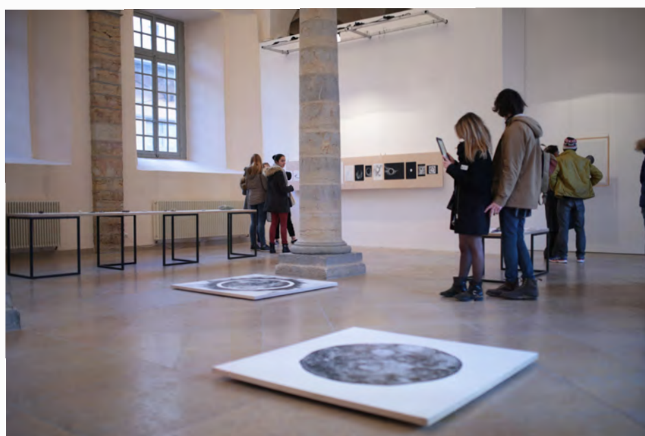
Adrien M & Claire B, Mirages et miracles , 2017, installations interactives, dessins, pierres, tablettes, vues de l'exposition au Lux, Scène nationale, Valence, France.