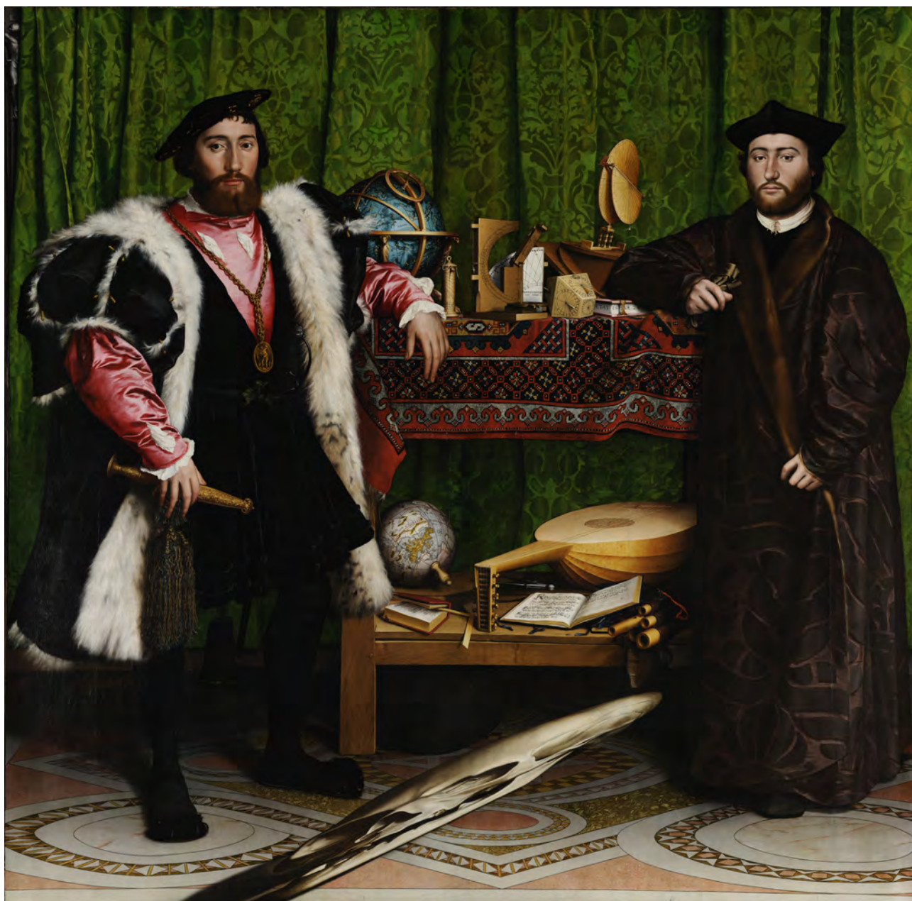
Hans Holbein, Les Ambassadeurs , 1533, peinture à l'huile sur panneau de chêne, 207 cm x 209,5 cm, National Gallery, Londres, Grande Bretagne.